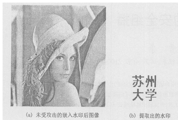
图 4 未受攻击的实验图像